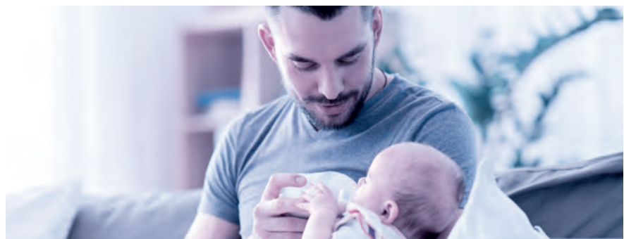
Vaterschaftsurlaub: innert sechs Monaten nach der Geburt zu beziehen.

Das Unternehmen muss dem Vater zehn arbeitsfreie Tage gewähren und hat für diese Zeit Anspruch auf 14 Taggelder. Es ist Sache des Arbeitgebers, bei der Ausgleichskasse – welche auch die EO-Beiträge abrechnet – den Antrag auf die Vaterschaftsentschädigung zu stellen. Der Antrag sollte aber erst gestellt werden, wenn der Arbeitnehmer den ganzen Vaterschaftsurlaub bezogen hat und der Arbeitgeber dies mit dem Antrag bestätigen kann. Die Auszahlung der Vaterschaftsentschädigung erfolgt dann nachgelagert