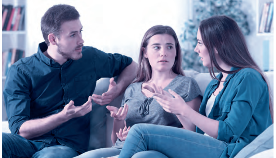
Kommt es zum Streit zwischen den Erben, muss der Willensvollstrecker schlichten.

Der Willensvollstrecker setzt den letzten Willen des Erblassers um. Dafür stellt er als Erstes ein Inventar auf, das er laufend nachführt. Er verwaltet die Erbschaft bis zur Teilung und muss darauf achten, dass das Vermögen erhalten bleibt. Er bezahlt die Schulden des Erblassers inklusive der Todesfallkosten und treibt offene Forderungen ein. Zur Verwaltung gehören auch die laufenden Geschäfte, beispielsweise muss er sich um den Unterhalt von Liegenschaften kümmern, laufende Verträge kündigen oder allenfalls die Liquidation einer Einzelunternehmung umsetzen. Er ist verantwortlich für die Erstellung der